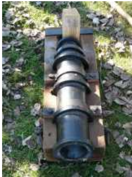
Doc. A. Parbeau

1346, utilisation de 3 bombardelles (petites bombardes) par Edouard III, roi d'Angleterre , à la bataille de Crécy en Ponthieu contre l'armée française.