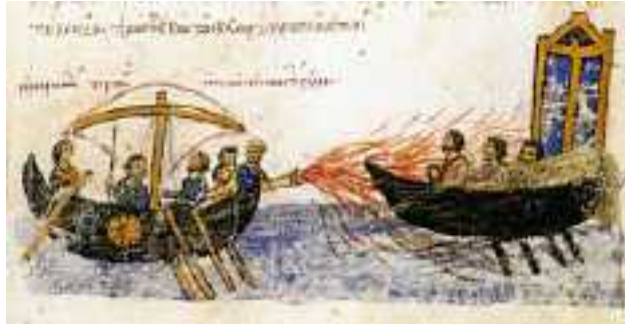
Attaque navale à l'aide du feu Grégeois.

En 479 avant Jésus Christ, les Perses utilisent des torches volantes au siège de Platée en Béotie ( Sont-elles déjà l'ancêtre des fusées utilisant une poudre comme moyen de propulsion, ou de grandes flèches enflammées lancées avec une sorte de catapulte... ? )