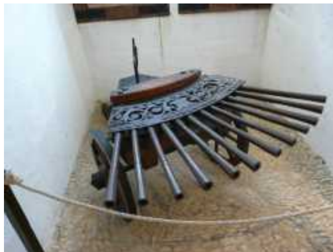
Ribaudequin ou Orgue (Château de Castelnaud en Dordogne. Très intéressant à visiter !)

C'est une sorte de « Trait à poudre » à canon rallongé (40 à 50 cm, d'où la désignation par sa plus grande longueur de canon faisant penser à une petite couleuvre), monté sur un fût de bois que l'on utilise, coincé sous l'aisselle. Certaines possèdent un croc en faisant une hacquebute à canon rallongé. L'allumage se fait au boutefeu à mèche. Vitesse de la balle : 240 mètres par seconde pour un calibre de 18 mm.