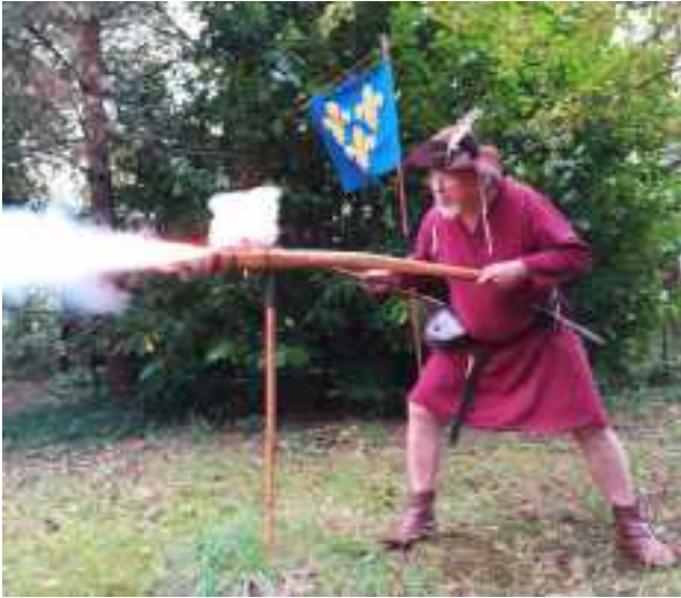
Tir avec une hacquebute primitive appuyée sur une fourche de portage appelée « Fourchine ou fourquine »