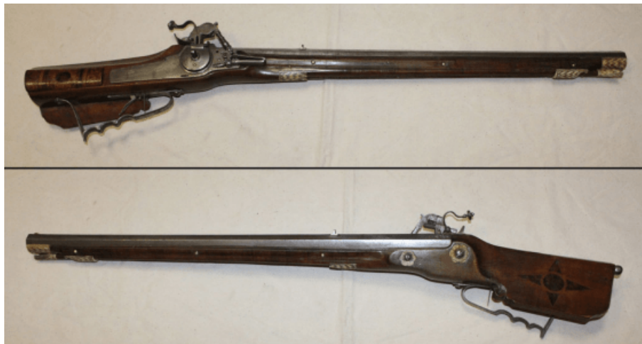
Arquebuse à platine à rouet (1515 / 1660)

Il existe aussi des arquebuses à crosse très courbée faites pour prendre appui sur la poitrine du tireur. Elles sont connues sous le nom de « Pétrinal » ou « Poitrinal ».