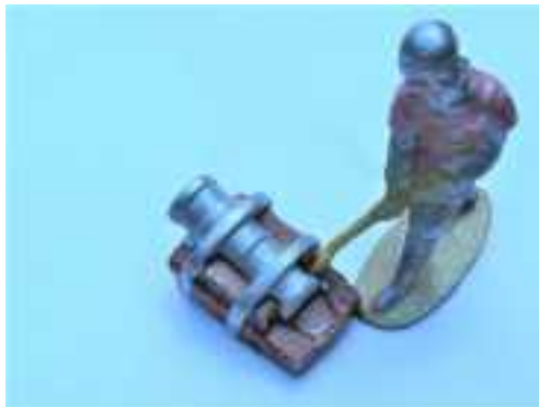
Jouet figurant une bombarde et son servant artilleur y « boutant » le feu.

Le moine anglais Roger Bacon travaille également sur des fusées incendiaires .