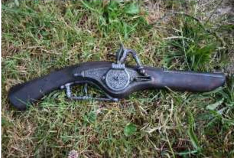
Pistolet à rouet du 16 e siècle

Bien que l'on puisse trouver des armes portatives à canon très court dès 1380, qui sont mises à feu par des boutefeux à mèche ou des ringards (tige de fer chauffée au rouge dans un brasero), et souvent fixé sur des hampes en bois, on ne peut les considérer comme pistolets car trop longues, mais plutôt comme ancêtre de l'arquebuse.