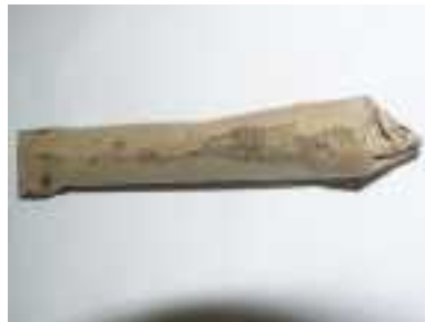
Cartouche en papier de fusil réglementaire Français (la balle ronde en plomb est dans la partie avant de la cartouche devant la poudre)

1728-40 Généralisation en France de la cartouche de guerre en papier , comportant 10 à 12 grammes de poudre noire ( suivant la qualité de la poudre ) et une balle de 16,3 mm en général. La balle est plus petite d'environ 1,2 mm que le calibre de 17,5 mm, pour qu'elle rentre facilement lors du rechargement, même si le canon est un peu encrassé par le tir précédent. Il n'y a plus de calepin de tissu graissé avec la cartouche, le papier de celle-ci en faisant office, tassé avec elle lors du rechargement. ( La cartouche en papier existe pour les mousquets depuis 1644 en Suède ). Elle augmente ainsi la vitesse de chargement de l'arme et en simplifie la manœuvre.