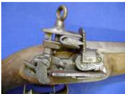
Platine à la Miquelet (1600)

Enfin inspirée des deux précédentes la platine à la française inventée par Marin Le Bourgeois armurier de Lisieux vers 1610 sera adoptée par l'ensemble des pays.