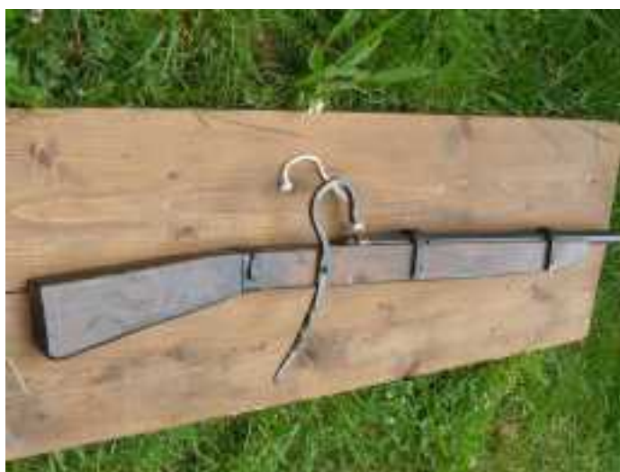
Arquebuse primitive à serpent et sa mèche d'allumage (1460)

Vers 1445, apparition du « Canon » ( de canonne, gros tube en italien ) des frères « Bureau », « bombarde légère moderne » à calibre standardisé, montée sur affût à grandes roues à rayons, et équipée d'un système de pointage à crémaillère percée. Portée d'environ 600 mètres (320 toises), ce qui surpasse en distance les plus puissantes machines de guerre à contrepoids de l'époque comme le trébuchet, qui n'excèdent pas 250 mètres. Ce « canon » permet de tirer soit des boulets de fonte de fer, soit de la plommée ( mitraille ). Cette artillerie à poudre (300 bouches à feu) initiée et dirigée par les frères Bureau, fera « merveille » et amorcera la fin de la guerre de cent ans le 17 juillet 1453 à la bataille de Castillon (Gironde) qui verra la défaite des troupes anglaises commandées par le lieutenant général de Guyenne John Talbot.