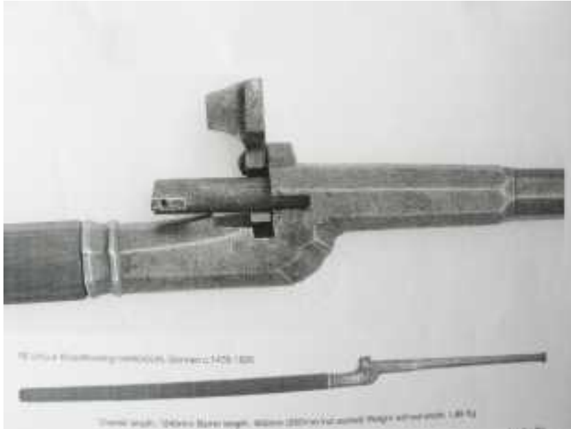
Arme visible au château de Castelnaud en Dordogne Très intéressant à visiter

Vers 1460 - 1500 une cartouche métallique ( adaptée ici à une coulouvrière à main ) comportant poudre et balle , sur l'idée des boîtes à feu « culasses mobiles » de canon de type « veuglaire », pour coulouvrière à main et Arquebuse à chargement par la culasse fut inventée (Germanie). Elle n'eut pas un franc succès, car coûteuse, délicate à fabriquer et présentant sans doute des fuites de gaz au niveau de la culasse, donc des risques de brûlure. Mais néanmoins l'idée de la cartouche à chargement par la culasse, qui plus est métallique, était née.