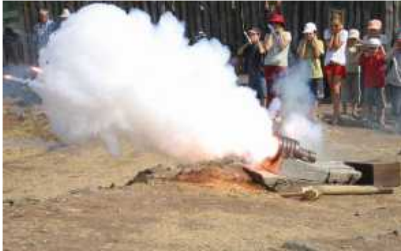
Tir à la Bombardelle - Doc. Château de Calmont d'Olt (Aveyron) très intéressant à visiter !

1346, utilisation de 3 bombardelles (petites bombardes) par Edouard III, roi d'Angleterre , à la bataille de Crécy en Ponthieu contre l'armée française.