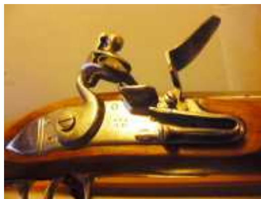
Platine à la Française (1610)