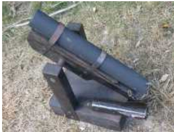
Reconstitution du lance-fusée (et sa fusée) de Jehan Froissart

Vers 1370, le « Baston à feu ou Trait à poudre »: petit canon portatif à main, de calibre 15 à 30 mm environ, monté sur une hampe en bois ou en fer et propulsant de petits boulets de pierre, puis de plomb, soit appuyé sur la poitrine du tireur protégée d'une armure, soit la hampe tenue fermement, coincée sous l'aisselle L'allumage se fait à l'aide d'un « boutefeu », baguette à laquelle est fixée une mèche allumée, ou d'un « ringard », tige de fer dont l'extrémité courbée est chauffée au rouge par un brasero. Si le trait est équipé d'un croc, il devient « Hacquebute ».