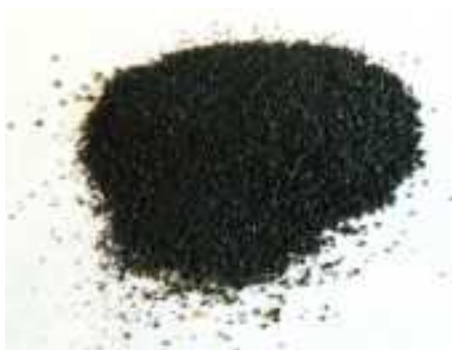
Poudre noire

Au VII ème siècle le feu grégeois : Mélange visqueux de poix, naphte, soufre, etc. ( on ne connaît pas sa composition exacte ) qui enflammé, est projeté chaud et liquide sur l'ennemi, ses bateaux et ses constructions. Étant plus léger que l'eau, il flotte au-dessus, et ne peut être éteint par elle. Il est comparable au « Napalm », mélange gélifié d'essence de pétrole et de palmitate d'aluminium, très employé par les américains pendant la guerre du Vietnam (1955 à 1975). Son invention serait attribuée à Callinicius d'Héliopolis, architecte réfugié à Constantinople au VII ème siècle Il est probable qu'il soit plus ancien dans des versions simplifiées employées depuis l'antiquité.