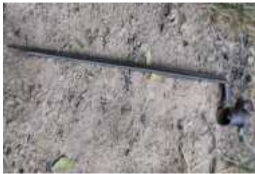
Baïonnette à douille, de fusil de guerre du 18 e siècle.

Initié par Louvois, ministre d'état, et sur le conseil du maréchal de Vauban, Louis XIV, généralisera par ordonnance la platine à silex à la française ( déjà partiellement en service dans l'armée depuis 1660 sur des mousquets allégés dits à fusil ), sur les mousquets en allégeant leur poids en 1703 . La platine à silex n'est rien d'autre que l'adaptation du briquet à silex ( nommé « fusil » depuis le moyen-âge ), sur un mousquet plus léger pour remplacer l'allumage à mèche.