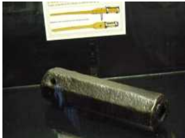
Canon d'hacquebute primitive (Château de Calmont d'Olt)

Vers 1370, l'hacquebute (primitive) : Littéralement « canon à croc » du germanique « hakenbüchse », destinée à tirer en crochetant un mur ou une palissade avec son croc de fer situé en dessous de l'arme pour que le mur encaisse le recul à la place du tireur. Elle comporte un long fût de bois ( ou parfois de fer ), à l'avant duquel est fixé un canon de fer de courte dimension (20 à 25 cm). Son calibre fait généralement de 18 à 28mm. Une balle ronde en plomb, de 18 mm de diamètre part à la vitesse de 130 mètres par seconde, avec une charge de 4 grammes (7 grammes au moyen âge) de poudre noire. Allumage au boutefeu à mèche ou par un ringard chauffé au rouge. (Une planche de pin de 3 cm d'épaisseur est traversée à 15 mètres). C'est l'ancêtre de toutes les armes à feu portatives occidentales.