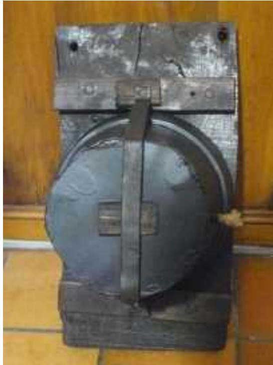
Pétard médiéval avec sa mèche d'allumage ici à droite

Le « Pétard », décrit depuis le 13 e siècle dans le « Liber ignium » de Marcus Graecus.