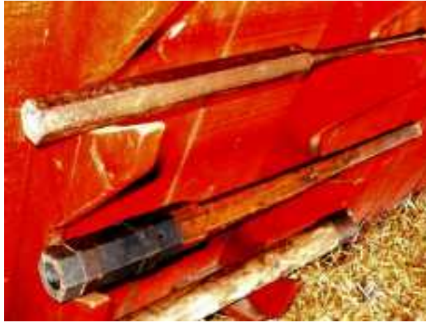
Trait à poudre à hampe de bois ou de fer (château de Calmont d'Olt)

Vers 1370, le « Baston à feu ou Trait à poudre »: petit canon portatif à main, de calibre 15 à 30 mm environ, monté sur une hampe en bois ou en fer et propulsant de petits boulets de pierre, puis de plomb, soit appuyé sur la poitrine du tireur protégée d'une armure, soit la hampe tenue fermement, coincée sous l'aisselle L'allumage se fait à l'aide d'un « boutefeu », baguette à laquelle est fixée une mèche allumée, ou d'un « ringard », tige de fer dont l'extrémité courbée est chauffée au rouge par un brasero. Si le trait est équipé d'un croc, il devient « Hacquebute ».