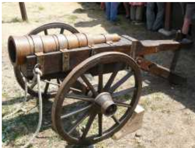
Canon sur affût du type des frères Bureau

Vers 1445, apparition du « Canon » ( de canonne, gros tube en italien ) des frères « Bureau », « bombarde légère moderne » à calibre standardisé, montée sur affût à grandes roues à rayons, et équipée d'un système de pointage à crémaillère percée. Portée d'environ 600 mètres (320 toises), ce qui surpasse en distance les plus puissantes machines de guerre à contrepoids de l'époque comme le trébuchet, qui n'excèdent pas 250 mètres. Ce « canon » permet de tirer soit des boulets de fonte de fer, soit de la plommée ( mitraille ). Cette artillerie à poudre (300 bouches à feu) initiée et dirigée par les frères Bureau, fera « merveille » et amorcera la fin de la guerre de cent ans le 17 juillet 1453 à la bataille de Castillon (Gironde) qui verra la défaite des troupes anglaises commandées par le lieutenant général de Guyenne John Talbot.