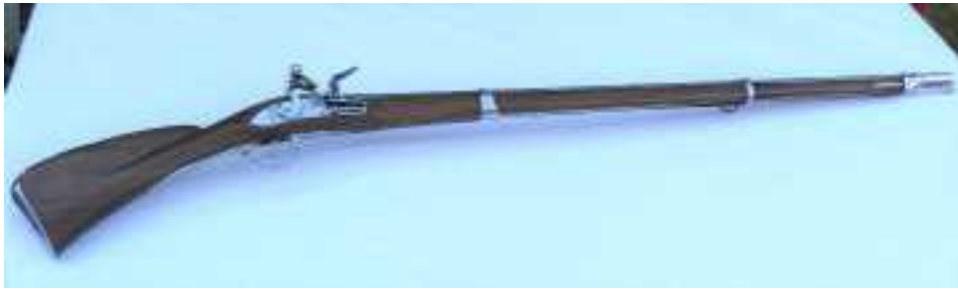
Doc A. Parbeau Fusil de guerre français modèle 1728 modifié 1746 dérivé du 1717

Initié par Louvois, ministre d'état, et sur le conseil du maréchal de Vauban, Louis XIV, généralisera par ordonnance la platine à silex à la française ( déjà partiellement en service dans l'armée depuis 1660 sur des mousquets allégés dits à fusil ), sur les mousquets en allégeant leur poids en 1703 . La platine à silex n'est rien d'autre que l'adaptation du briquet à silex ( nommé « fusil » depuis le moyen-âge ), sur un mousquet plus léger pour remplacer l'allumage à mèche.