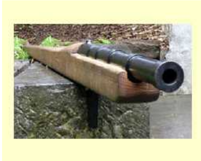
Coulevrine à main 1410 (Doc « atelier La Bigorne » Jean Robert Seifert)

A partir de 1410, apparaît « la coulevrine à main » appelée « scopette » dans le sud de la France (de « Schioppetto » en italien du bruit que l'on peut faire en gonflant ses joues d'air pour les vider brutalement, nom qui sera donné aussi plus tard au tromblon, fusil court à bouche évasée sous la dénomination d'« Escopette ») :